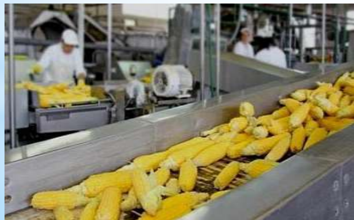
Переработка продукции растениеводства