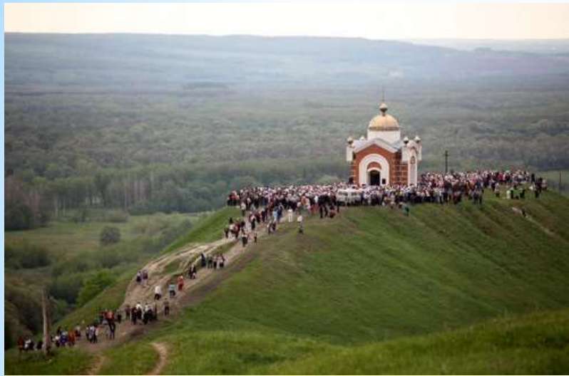
Центр паломнического туризма - Никольская гора