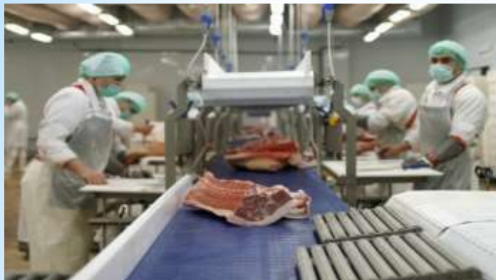
Переработка продукции животноводства