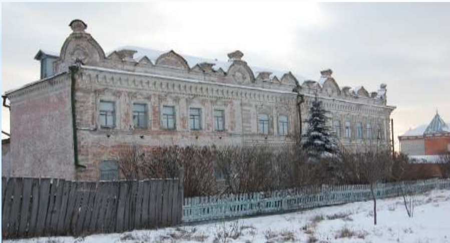
Множество памятников купеческой архитектуры